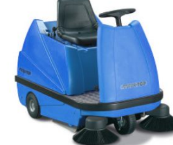
bis 20.000 m²