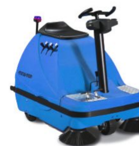
bis 8.000 m²