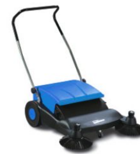
bis 1.000 m²