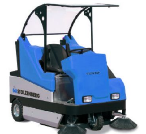
bis 80.000 m²

Dieses Typenblatt nennt die Angaben des Standardgerätes. Änderungen an Bereifung, Hubgerüst oder Zusatzinstallationen können zu abweichenden Werten führen. Irrtümer, Änderungen und Verbesserungen bleiben vorbehalten. Mit Erscheinen eines neuen Datenblatts verliert dieses Datenblatt seine Gültigkeit.