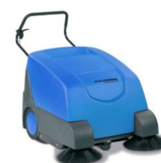
bis 4.000 m²