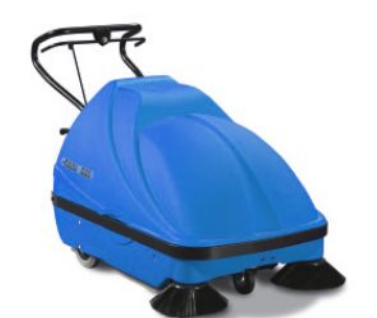
bis 6.000 m²