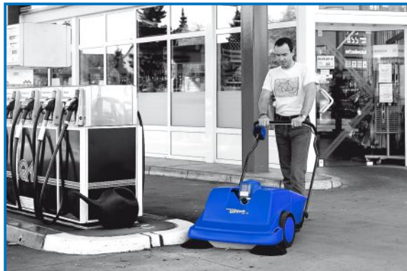
Außenbereiche schnell und effizient von Staub und Verunreinigungen säubern.

Das TWS-Prinzip kombiniert mit der Staubabsaugung garantiert höchste Zuverlässigkeit in der Kehrleistung. Sowohl die Benzinversion KSV als auch die Elektroversion KSE sind sehr leicht zu handhaben, extrem robust und zudem sehr laufruhig. Der Fahrtrieb wirkt über Freiläufe auf die beiden großen Laufräder und sorgt auch in Kurven für ein perfektes Handling beider Tandem-Versionen. Typische Einsatzbereiche sind z.B. Gewerbebetriebe, Industrie, Parkhäuser und Kommunen, kurz: alle Bereiche, in denen Innen- oder Außenflächen schnell, effizient und staubfrei gekehrt werden müssen.