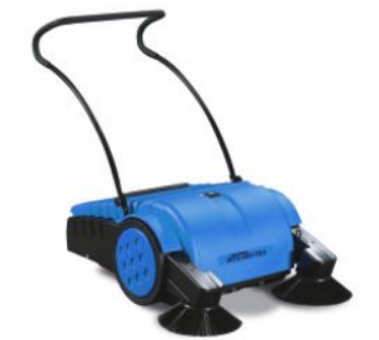
bis 2.000 m²