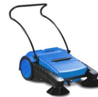
bis 2.000 m²