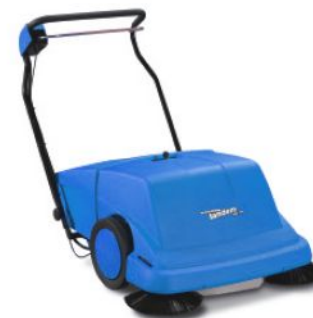
bis 3.000 m²