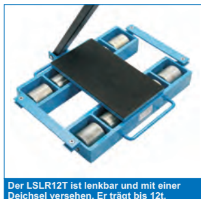
Der LSLR12T ist lenkbar und mit einer Deichsel versehen. Er trägt bis 12t.