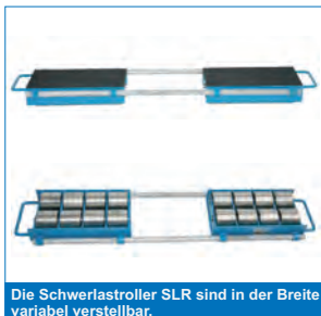
Die Schwerlastroller SLR sind in der Breite variabel verstellbar.

Dieses Typenblatt nennt die Angaben des Standardgerätes. Änderungen an Bereifung, Hubgerüst oder Zusatzinstallationen können zu abweichenden Werten führen. Irrtümer, Änderungen, Verbesserungen und Bauart bedingte Anpassungen vorbehalten. Mit Erscheinen eines neuen Datenblattes verliert dieses Datenblatt seine Gültigkeit.