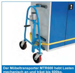
Der Möbeltransporter MTR600 hebt Lasten mechanisch an und trägt bis 600kg.