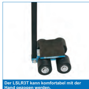
Der LSLR3T kann komfortabel mit der Hand gezogen werden.