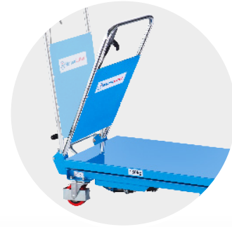
Platzsparend: Modell SPA150 ist mit einem klappbaren Handgriff ausgestattet