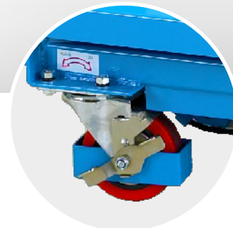
Feststellbremse an den Lenkrädern für Sicherheit beim Heben, Be- und Entladen