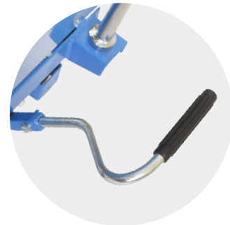
Kraftschonend anheben per Fußpedal und stufenlos absenken am Handgriff