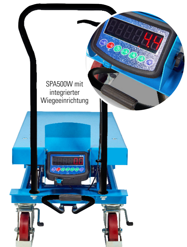
Dieses Typenblatt nennt die Angaben des Standardgerätes nach VDI 2198. Änderungen an Bereifung, Hubgerüst oder Zusatzinstallationen können zu abweichenden Werten führen.

Das Modell SPA500W mit integrierter Wiegefunktion ist ideal für Verpackungs- und Versandarbeiten. Beim Beladen können Waren direkt auf dem Hubtisch gewogen und für den Versand vorbereitet werden – ohne Umwege über separate Waagen. Das spart Zeit, reduziert Wege und sorgt für eine präzise Gewichtskontrolle bei jedem Paket oder Versandgut.