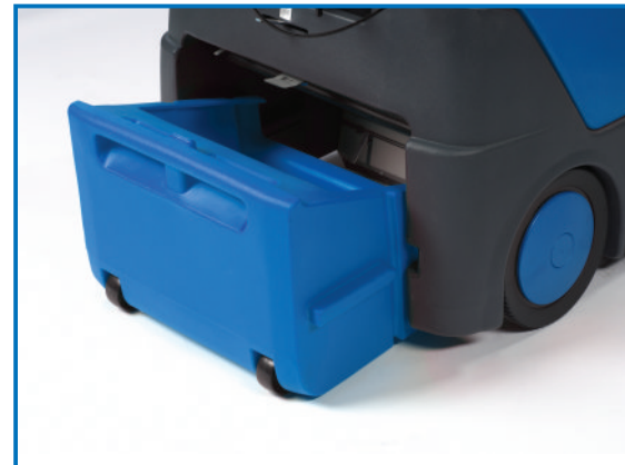
Die konsequente Integralbauweise sorgt für eine sehr robuste und haltbare Struktur.

Über 50 Jahre Know-how sind in die Entwicklung dieser Kehrmaschinen eingeflossen. Das Ergebnis: Eine Kehrmaschine auf dem neuesten Stand der Technik.